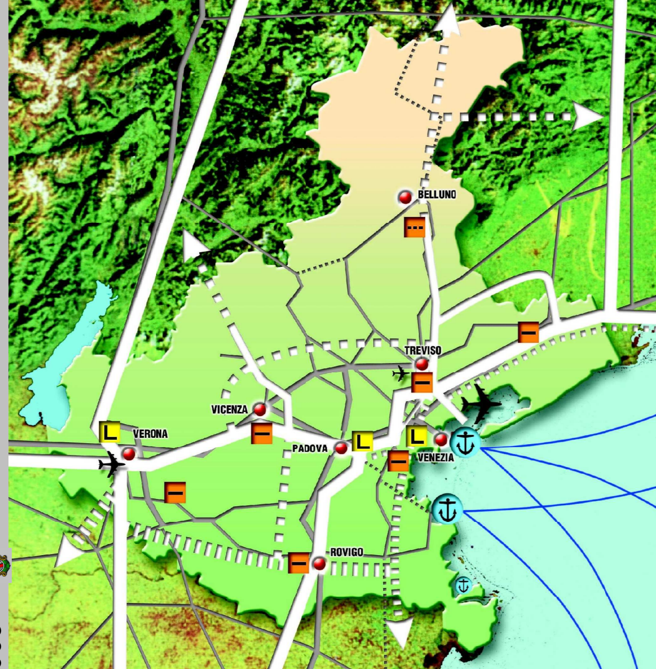
RETE DELLA LOGISTICA REGIONALE