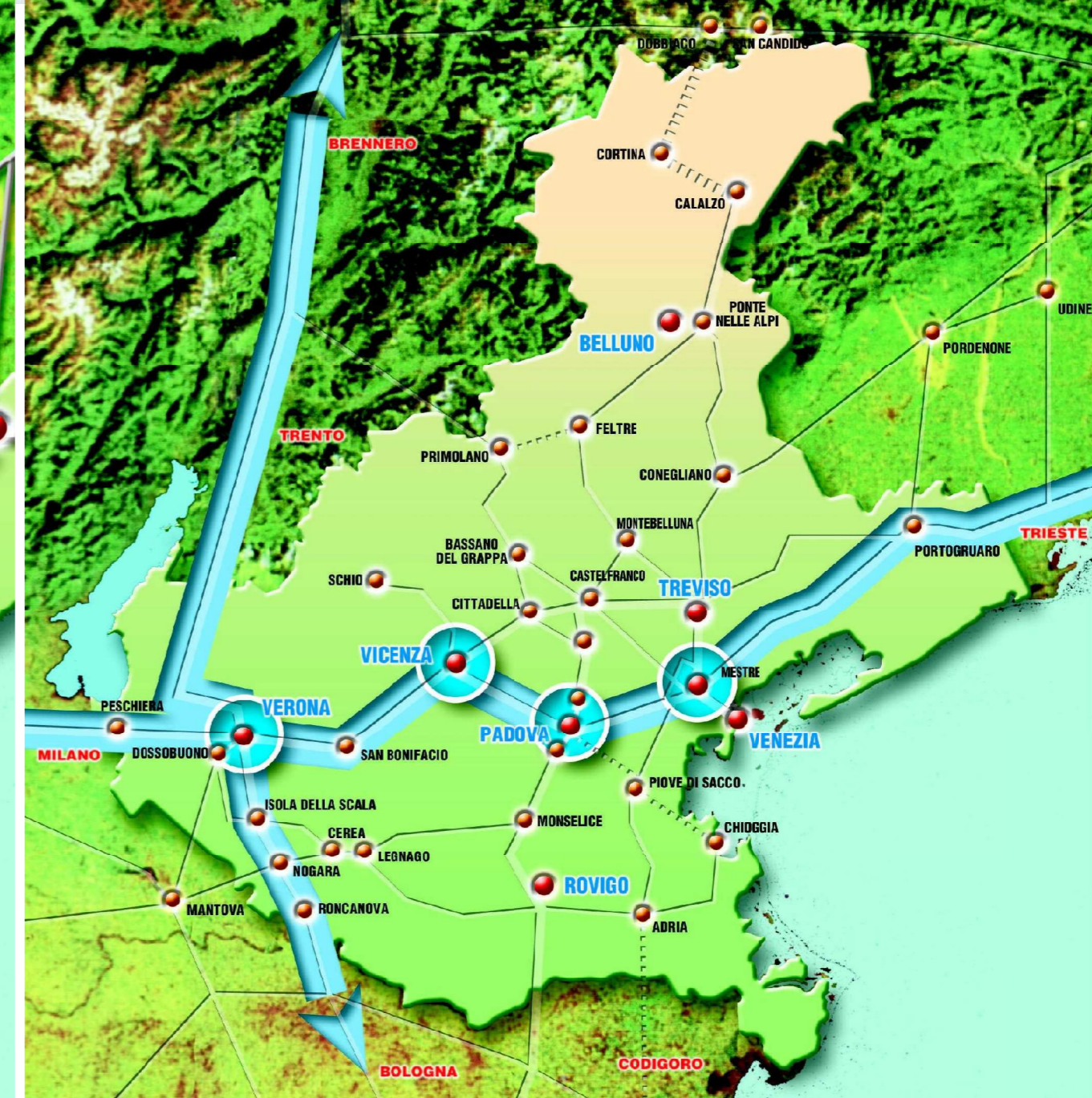
LINEA ALTA CAPACITÀ FERROVIARIA