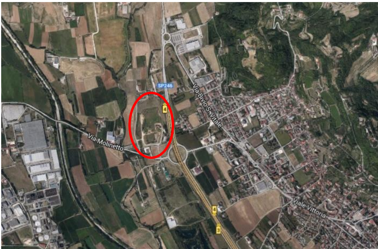
Fig. 1. Estratto di ortofoto. In rosso l'edificio oggetto di intervento.

Le figure che seguono sono ad inquadramento della zona.