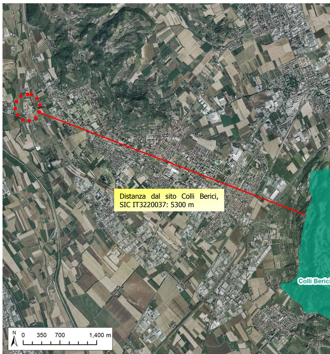
Fig. 3. Estratto di ortofoto con individuazione dell'area oggetto di intervento e del SIC IT3220037.