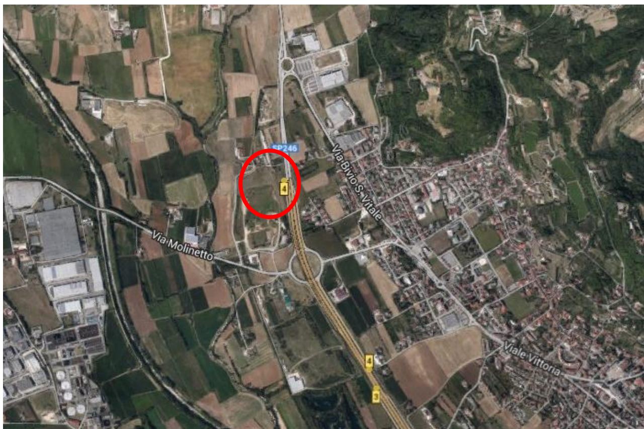
Fig. 1. Estratto di ortofoto. In rosso l'edificio oggetto di intervento.