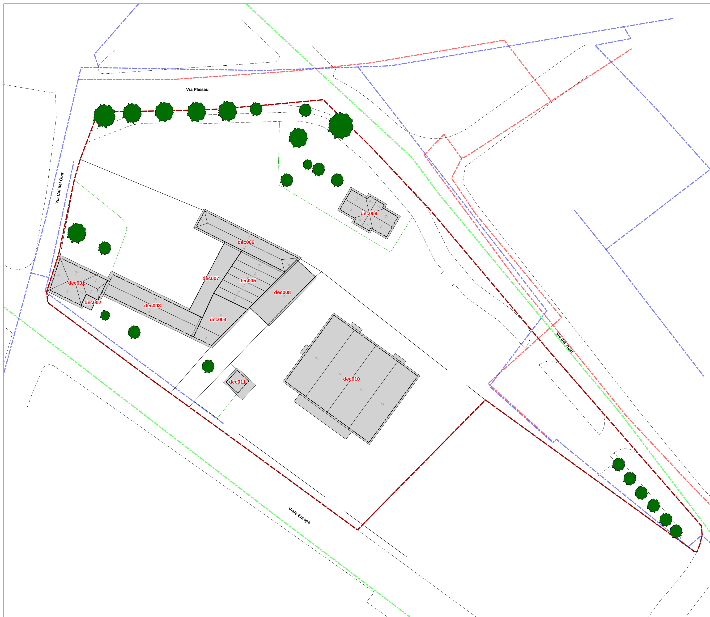
PDR zona Duomo