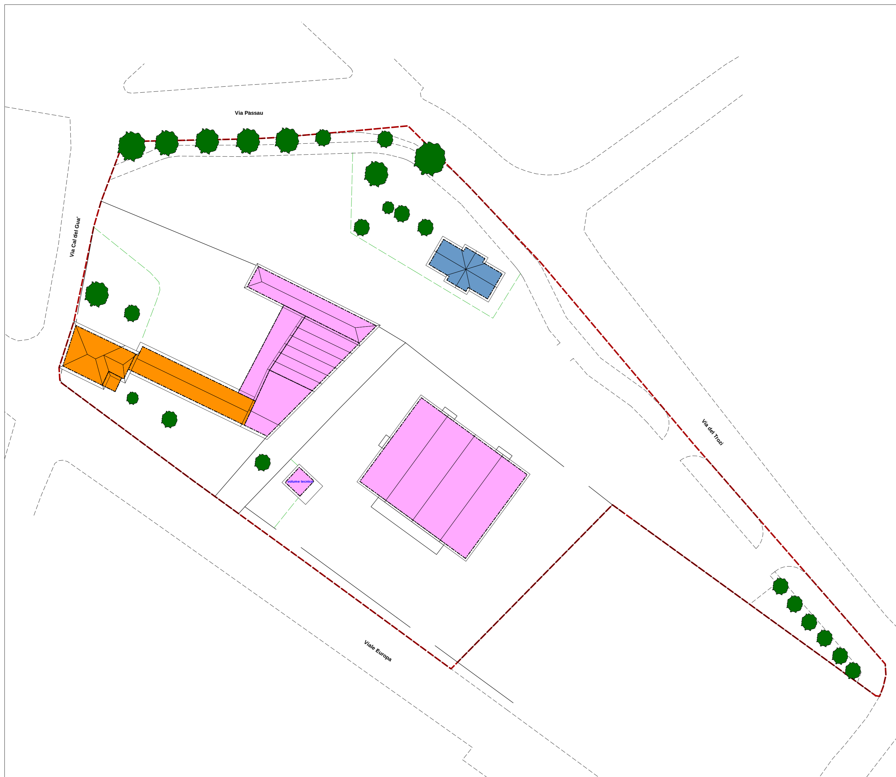
PDR zona Duomo