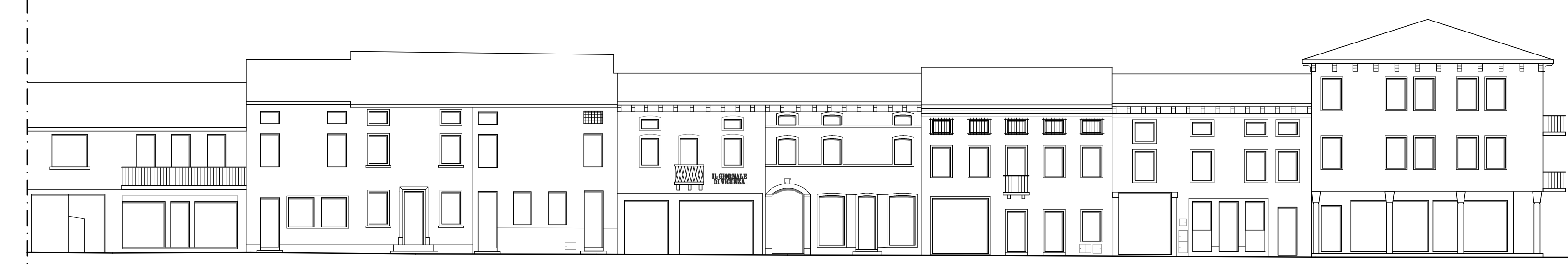
Prospetto attuale - Via Lorenzoni lato sud