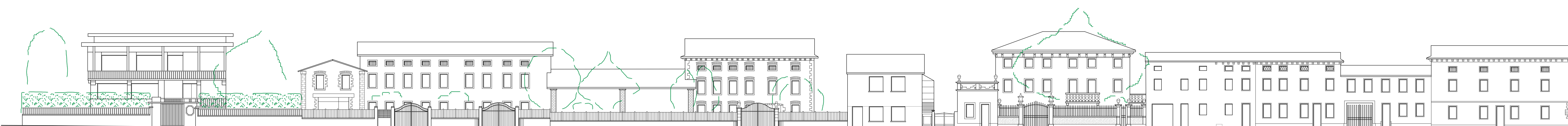
Prospetto attuale - Via Lorenzoni lato nord