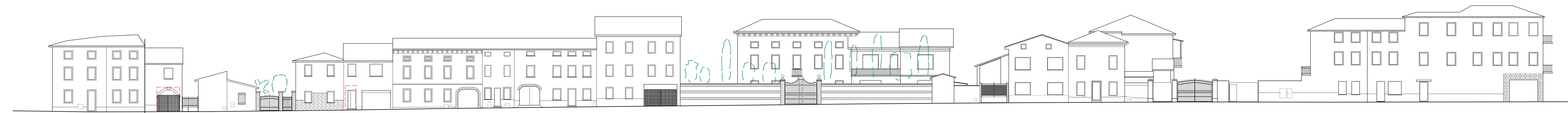
Prospetto di progetto - Via Conti Gualdo lato ovest

CITTA' DI MONTECCHIO MAGGIORE Provincia di Vicenza