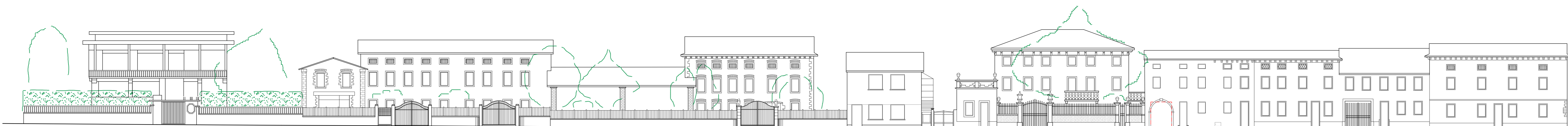
Prospetto di progetto - Via Lorenzoni lato nord