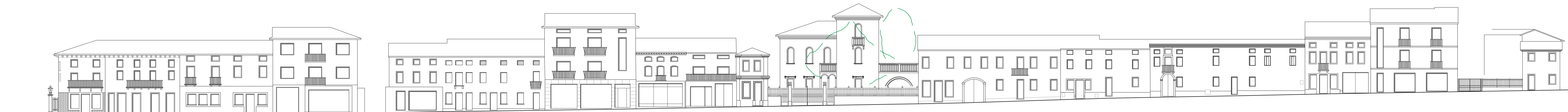
Prospetto attuale - Corso Matteotti lato nord