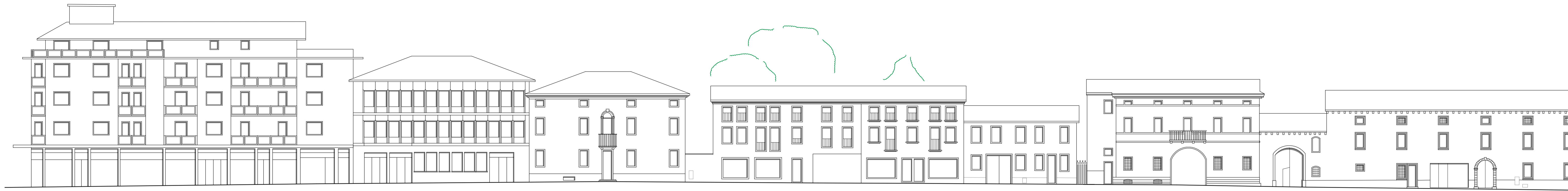
Prospetto attuale - Corso Matteotti lato sud