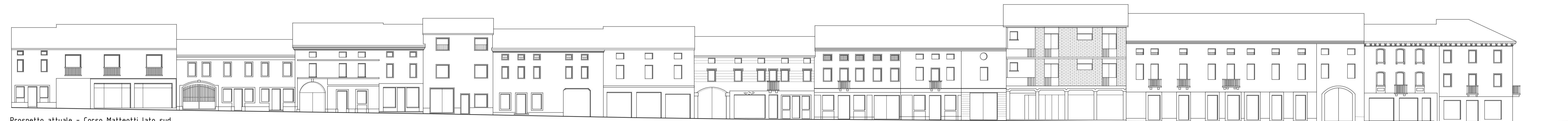
Prospetto attuale - Corso Matteotti lato sud