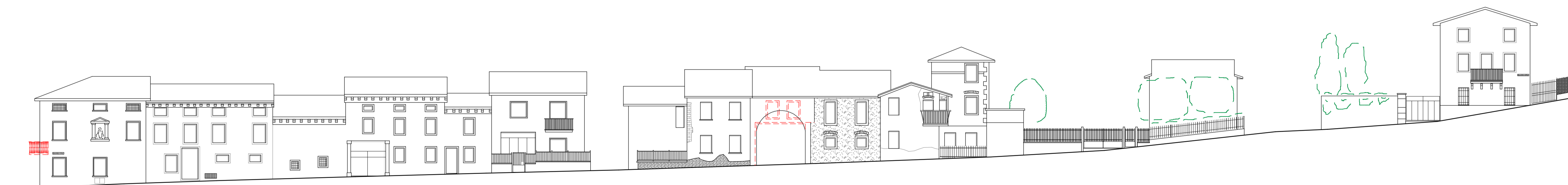
Prospetto di progetto - Via San Valentino lato ovest