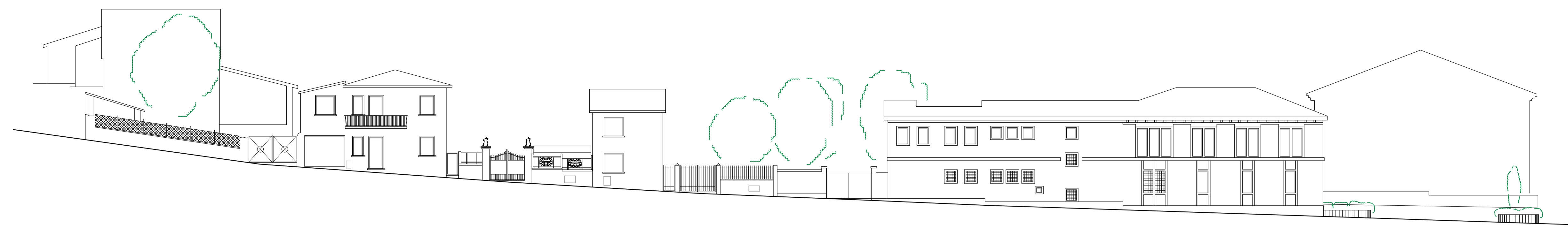
Prospetto attuale - Via San Valentino lato est