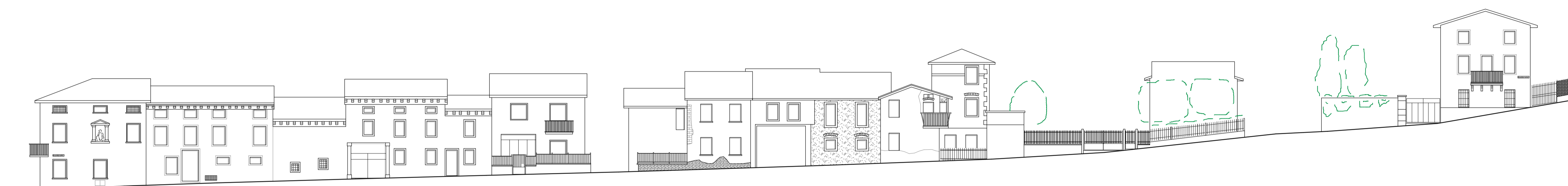
Prospetto attuale - Via San Valentino lato ovest